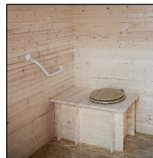
Prototype Photo non contractuelle